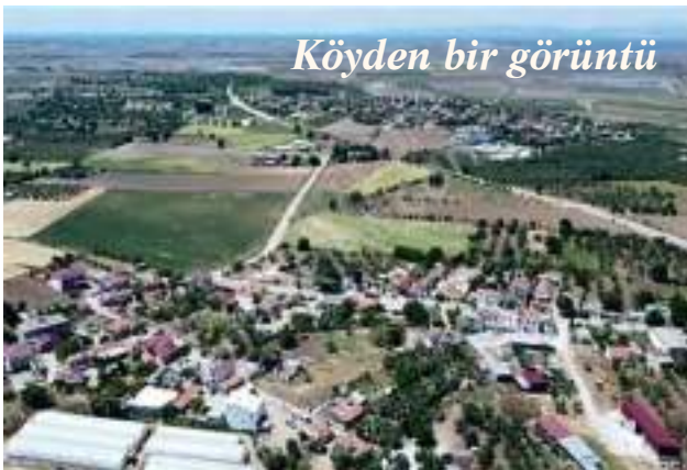
Köyden bir görüntü

Bu bahsi geçen bölge Akçapınar – Gökçalı – Civler üçgeninde, Civler köyüne giderken dere yatağının hemen sol tarafında kalmaktadır.